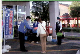
商業施設で犯罪被害防止キャンペーン