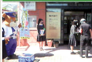
金融機関で「電話で「お金」詐欺」被害防止キャンペーン