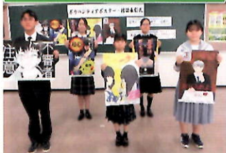
高校生防犯ボランティアによる防犯ポスターの作成