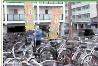
JR 稲田口駅で自転車盗難被害防止キャンペーン