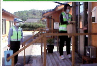
被災地の仮設住宅で犯罪被害防止の呼びかけ