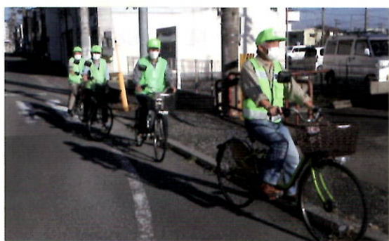
電動アシスト自転車によるパトロール

これ以降、地区ごとに2～5名を1グループとし、計7グループで電動アシスト自転車を使用した巡回パトロールを毎週実施しています。