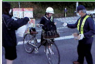
管内中学校で自転車鍵かけキャンペーン