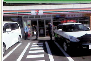
コンビニで犯罪抑止の呼びかけ