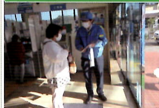
金融機関で「電話で「お金」詐欺」被害防止キャンペーン