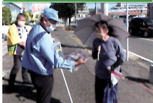
金融機関で「電話で「お金」詐欺」被害防止キャンペーン