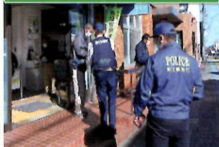
金融機関で「電話で「お金」詐欺」被害防止キャンペーン