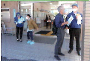
金融機関で「電話で「お金」詐欺」被害防止キャンペーン