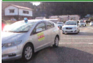
全国地域安全運動出発式における青バトでの一斉パトロール