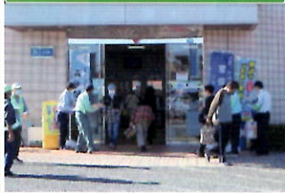
金融機関で「電話で「お金」詐欺」被害防止キャンペーン