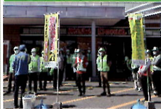
商業施設で犯罪被害防止キャンペーン