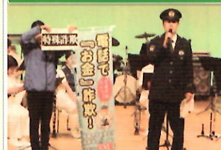
市主催のイベントで「電話で「お金」詐欺」被害防止講話