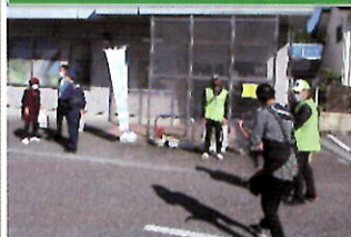
金融機関で「電話で「お金」詐欺」被害防止キャンペーン