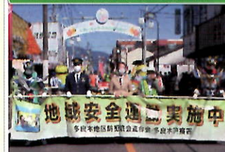
えびす祭りで防犯パレード