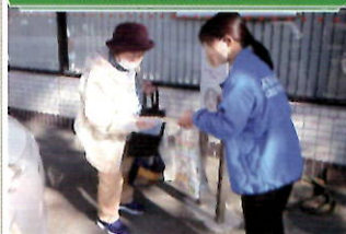
金融機関で「電話で「お金」詐欺」被害防止キャンペーン