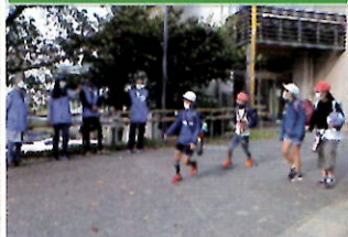
管内小学校で下校時の見守り活動