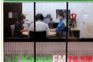
「エフエムやつしろ」で「電話で「お金」詐欺」等の注意喚起