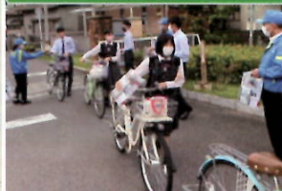
管内高校で自転車盗難被害防止やSNS被害防止の呼びかけ