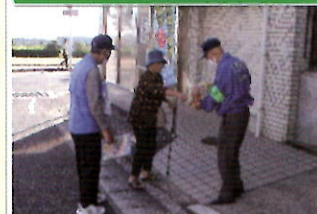
金融機関で「電話で「お金」詐欺」被害防止キャンペーン