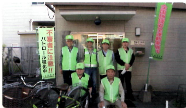
パトロールセンター

また、年間200日以上に及ぶ小中学校の登下校時通学路での見守り活動に加え、玉名駅駐輪場における清掃・防犯診断、防犯のぼり旗やポスター掲示等の広報啓発活動などにより、駅を中心とした玉名地区の防犯意識の向上と犯罪抑止を目指し、日々活動を行っています。