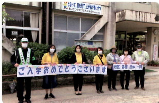
小学校の入学式での見守り活動

などで、「自分たちのまちは自分たちで守ろう!」をスローガンに、防犯協会、PTA、自治会が一体となって組織的に日々活動をしています。