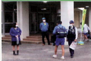
管内中学校で犯罪被害防止の呼びかけ