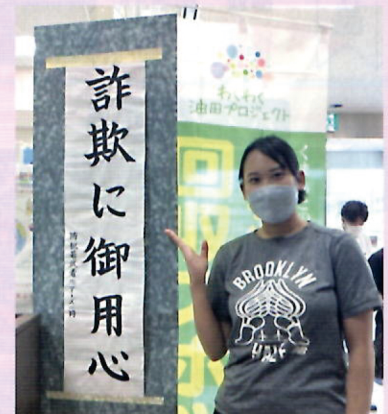
大学生防犯ボランティア団体「防犯若者ベアーズ」作成の広報啓発掛け軸（金融機関5か所で注意喚起）