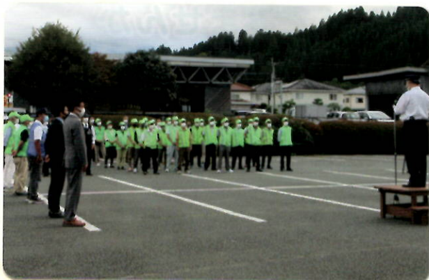
全国地域安全運動出発式への参加

また、自分たちの町は自分たちで守るという気概の下、隊員の士気も高く、防犯に関する研修会等に積極的に参加して、各種活動のスキルアップ及び活動の改善を行っています。