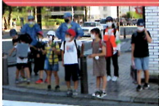
大江小学校校区で子供見守り活動を実施