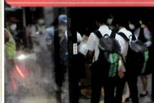
JR有佐駅で鍵かけキャンペーン