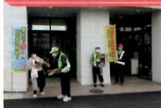
商業施設で犯罪抑止キャンペーン