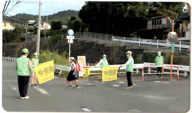
登下校時の見守り活動

また、登下校時の見守り活動や通学路における交通指導のほか、小学校の水防訓練等にも積極的に参加し、子供の安全確保に努めています。