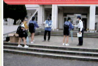
管内中学校で犯罪被害防止の呼びかけ