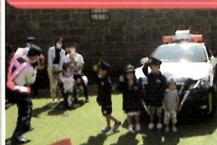
コンテナマルシェ内でポリスフェスティバル