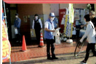
商業施設で「電話で「お金」詐欺」被害防止キャンペーン