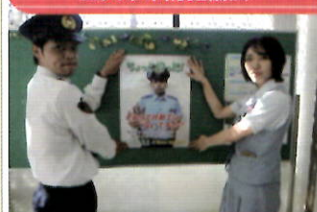
「電話で「お金」詐欺」被害防止ポスターを作成