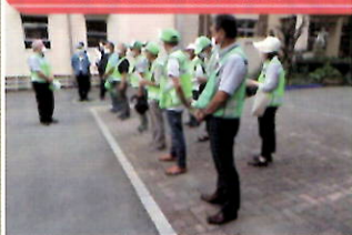
校区防犯協会との共同パトロール