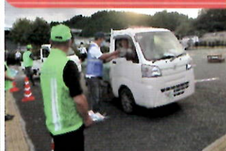
小国警察署前で犯罪被害防止キャンペーン