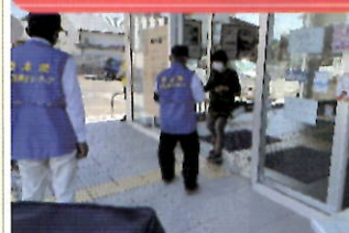
金融機関で「電話で「お金」詐欺」被害防止キャンペーン