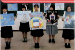
高校生防犯ボランティアによる防犯ポスターの作成