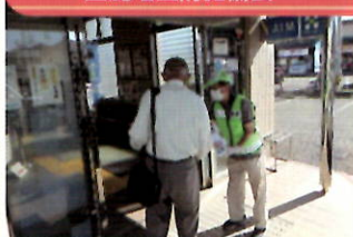
金融機関で「電話で「お金」詐欺」被害防止キャンペーン