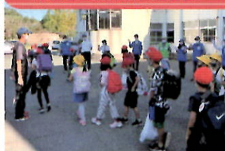
荒尾市立清里小学校で下校時の見守り活動を実施