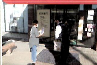
金融機関で「電話で「お金」詐欺」被害防止キャンペーン