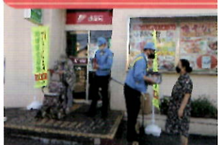
金融機関で「電話で「お金」詐欺」被害防止キャンペーン