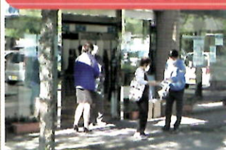
金融機関で「電話で「お金」詐欺」被害防止キャンペーン