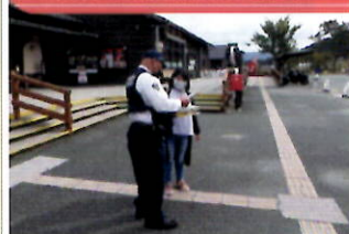
道の駅で犯罪抑止キャンペーン