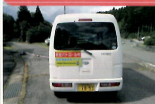
パトロールステッカーを作成し、民生委員車両に貼付