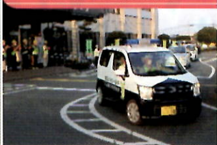
青パトを先導に防犯パトロール出発式