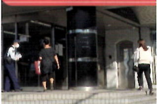
金融機関で「電話で「お金」詐欺」被害防止キャンペーン