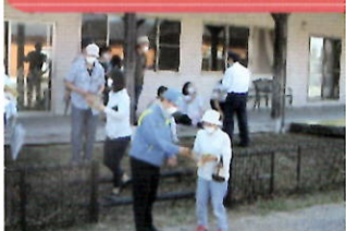
熊本豪雨仮設住宅で犯罪抑止キャンペーン