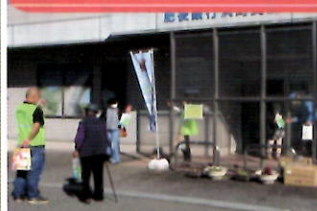
金融機関で「電話で「お金」詐欺」被害防止キャンペーン