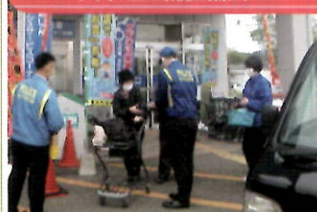
商業施設で犯罪抑止キャンペーン