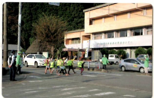
登下校時の見守り活動